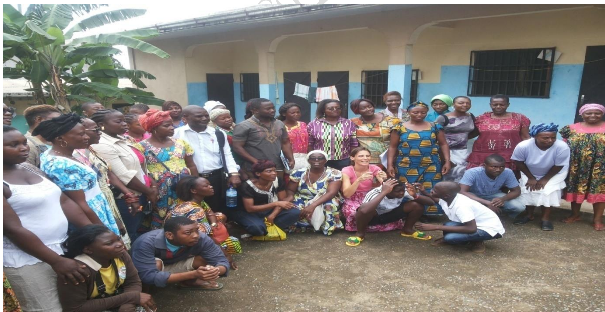
Journée de sensibilisation des parents des enfants porteurs de handicap mental

Nous n'avons fait aucune carte d'invalidité cette année, car pour des raisons que nous ignorons, les dossiers de demande de carte d'invalidité déposés en janvier n'ont pas connu de suite. Nous espérons que le problème sera résolu en 2017.