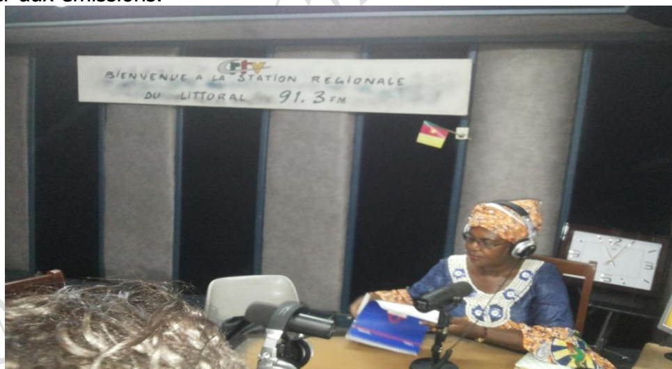
Invitée à la Station Régionale de la CRTV

Les radios FM 103, Miango FM, ELL'FM, et Dynamic FM se sont aussi intéressées aux activités de l'Association ; nous en voulons pour preuve les différentes invitations à participer aux émissions.