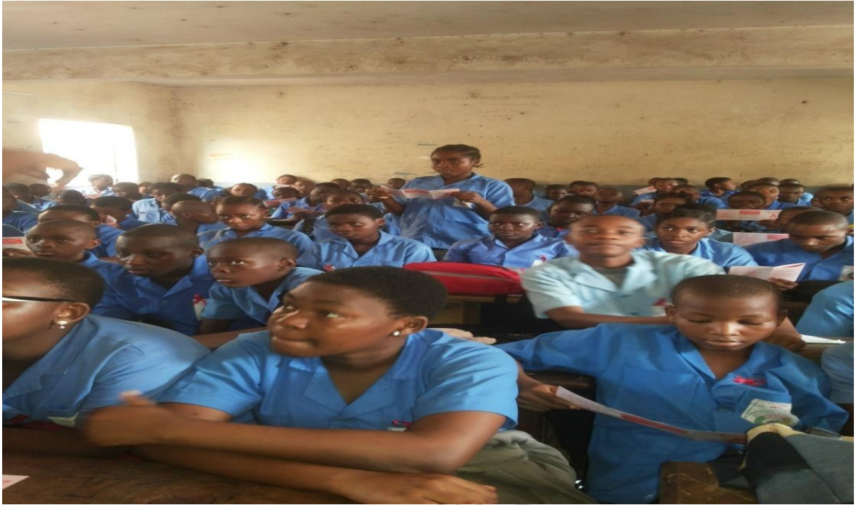
Journée du Sida 2017, Lycée Bilingue de Deïdo, Douala