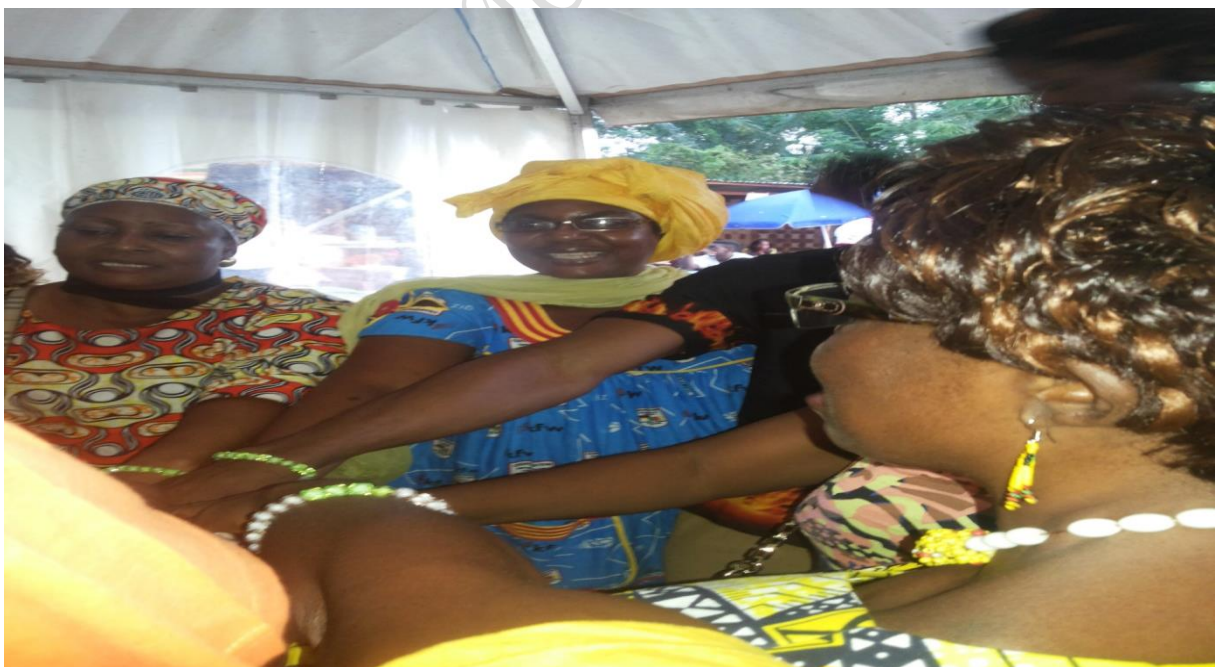
Les femmes prêtent serment pour mieux accompagner leurs filles

L'Association Femmes et Enfants a été invitée à participer à la foire transfrontalière de KYE-OSSI où plusieurs nationalités étaient représentées afin de présenter ses expériences en matière d'éducation de la jeune fille. 200 femmes et hommes ont été sensibilisés sur les problèmes liés à la santé sexuelle des jeunes. L'ONU Femmes qui participait elle aussi à cette foire en a profité pour former les femmes présentes au cycle menstruel ; après cette formation, les femmes ont prêté serment en disant qu'elles ne se tairont plus désormais sur les problèmes y relatifs.