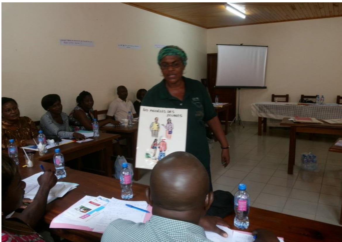
Séance de formation, présentation d'une image.